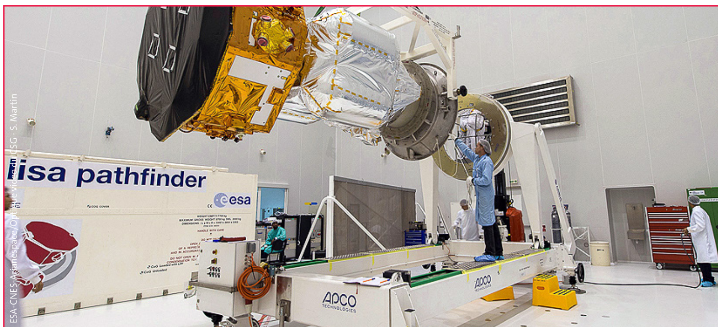
↑ LISA Pathfinder antes do lançamento.

Este documento contém atividades que os professores podem realizar com os seus alunos, com o objetivo de debater, nas aulas, as carreiras relacionadas com o espaço. Como parte integrante do projeto, professores de vários locais da Europa, são convidados a apresentarem os resultados destas atividades num evento sobre Carreiras Espaciais organizado pelos ESERO de cada país interveniente. No mesmo dia, está programada uma ligação de vídeo em direto com o astronauta Tim Peake da ISS.